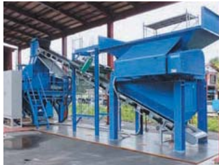
廃木材クラッシャ WE・HC