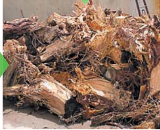
粗割りした木の根