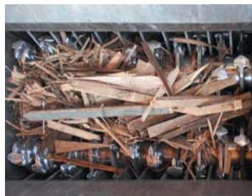
一次粗割クラッシャ