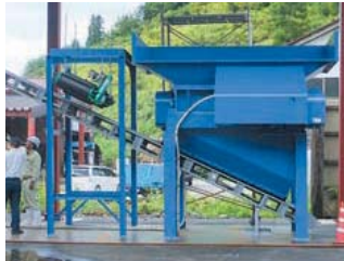
一次破碎機 (2軸ロール式)