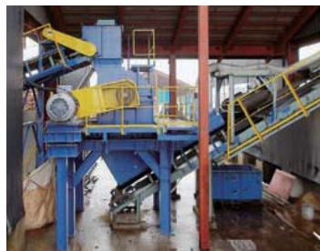
二次ハンマークラッシャ