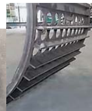
裏側に飛出防止板取付