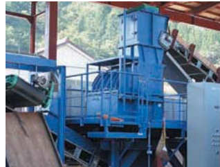
二次破碎機 (高速ハンマー式)

●本カタログ記載内容は平成26年6月現在のものです。改良等により内容に変更が生じる場合がありますので予めご了承ください。